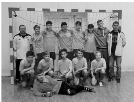
Starší žáci - 7. místo v OHL

Ženy se přes zimu opět zúčastnily turnaje v naší tělocvičně, jinak se znovu připravovaly na naší umělé trávě a v tělocvičně a sehrály, či ještě sehrají několik přípravných utkání.