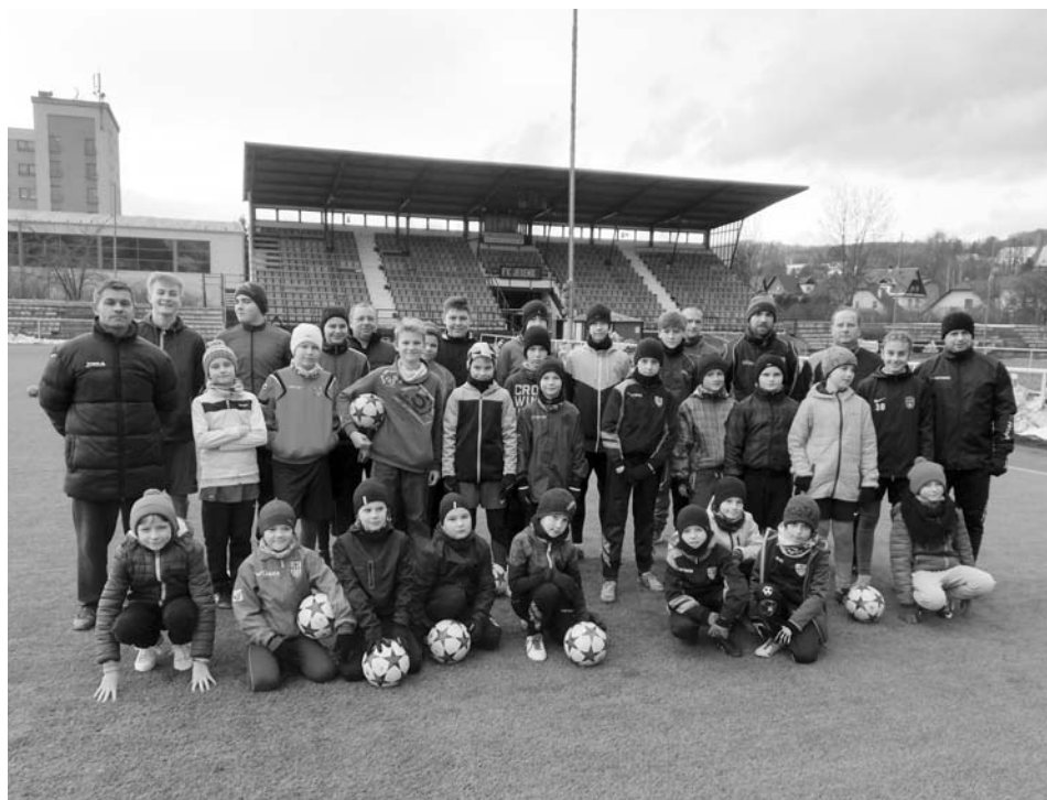
Žáci a příprava na soustředění v Jeseníku