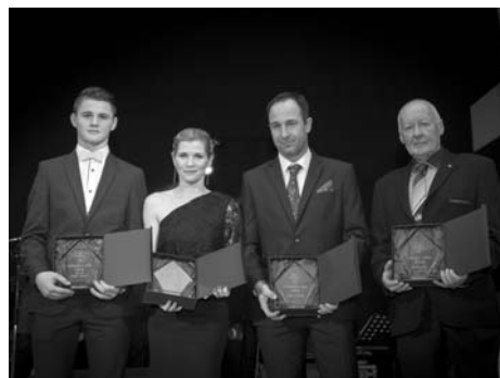
Ocenění v kategorii dospělých