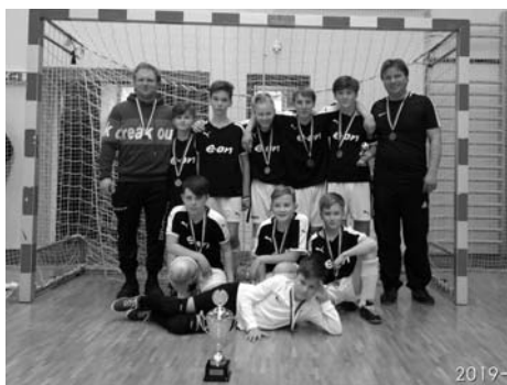
Mladší žáci - 2. místo v OHL