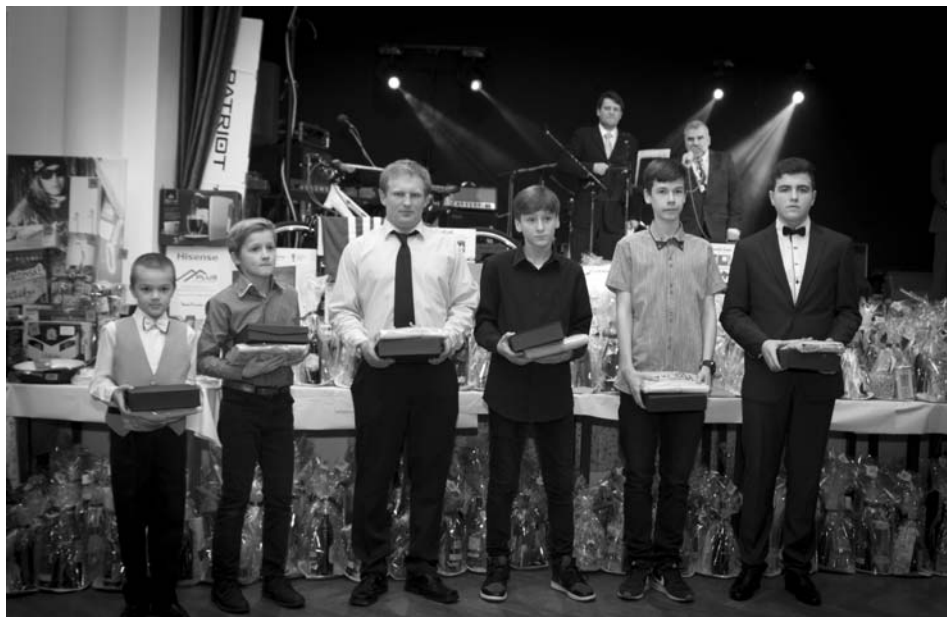
Ocenění v kategorii mládež