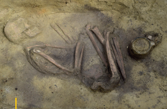
Kostrový hrob kultury se zvoncovitými poháry odkrytý na pohřebišti v trati „Mutěnická louka“.