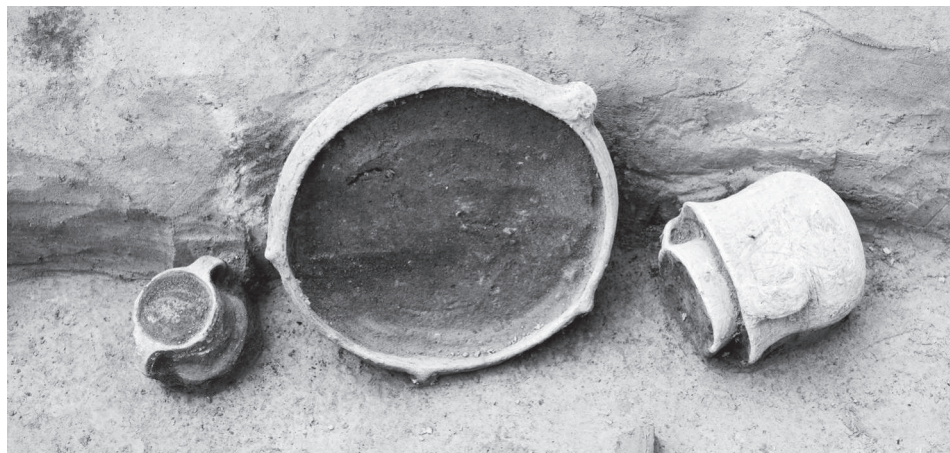
Část výbavy hrobu kultury se zvoncovitými poháry v trati „Mutěnická louka“. Mísa, dvojuchý džbánek, zvoncový pohár a v něm vsazený šálek.