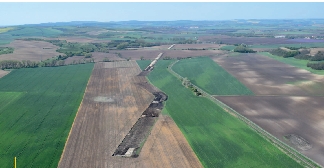
Letecké foto na lokality v trati „Mutěnická louka“ a „Servtské pole“.