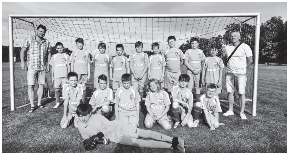
Mladší žáci Dubňany - Mutěnice