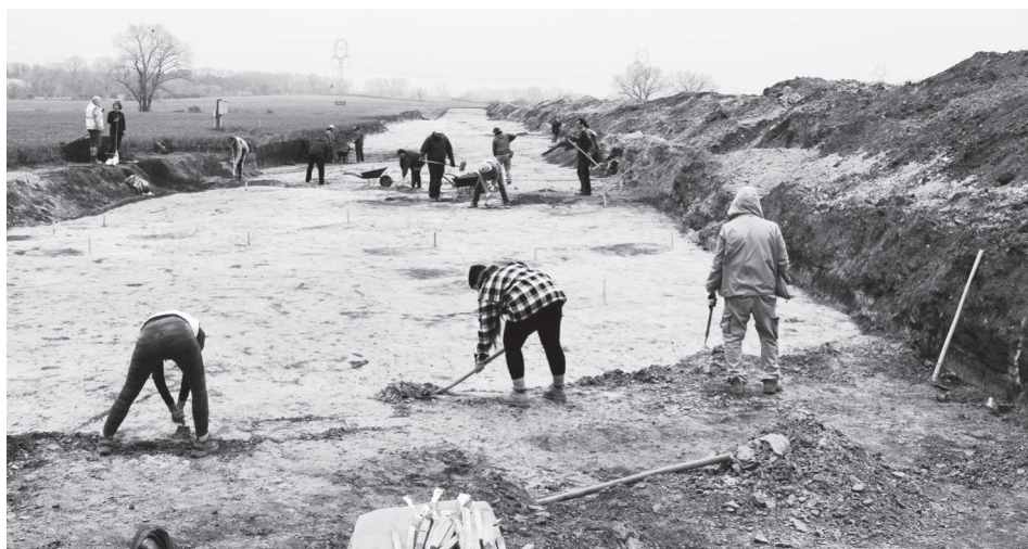
Pohled na plochu výzkumu v trati „Mutěnická louka“ od jihovýchodu.

Nejzajímavější nálezové situace, připomínající známý hororový román Řbitov zvířátek od Stephena Kinga, byly zachyceny ve dvou hlubokých zásobních jamách, umístěných poněkud stranou od vesnice. V zásypu první z nich byla objevena lidská kostra v nepietní po-