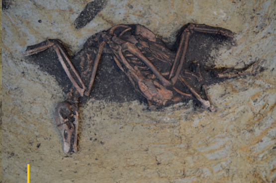
Kostra husy odkrytá v zásobní jámě.