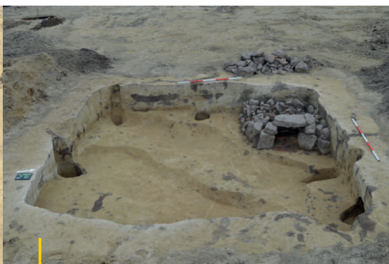
Slovanská chata s kamenným krbem.