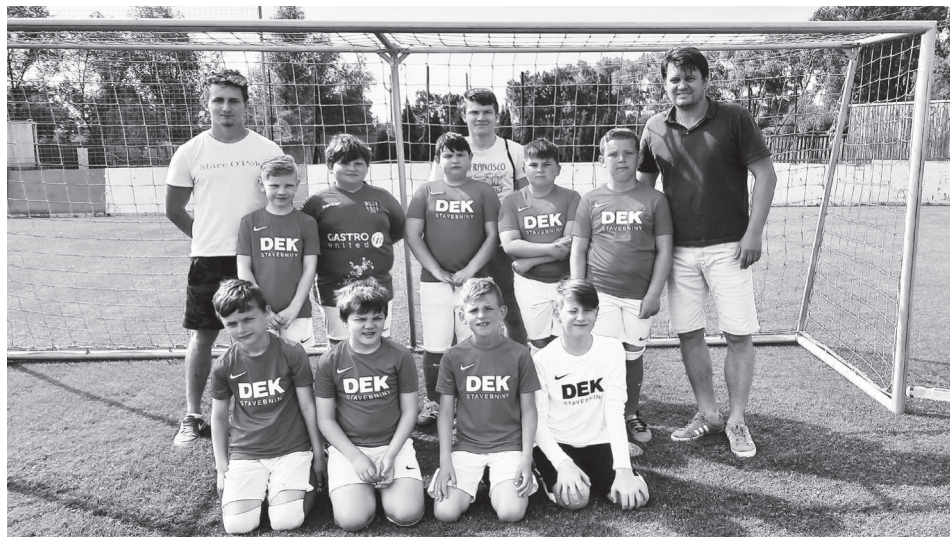
Starší příprava Mutěnice - Svatobořice