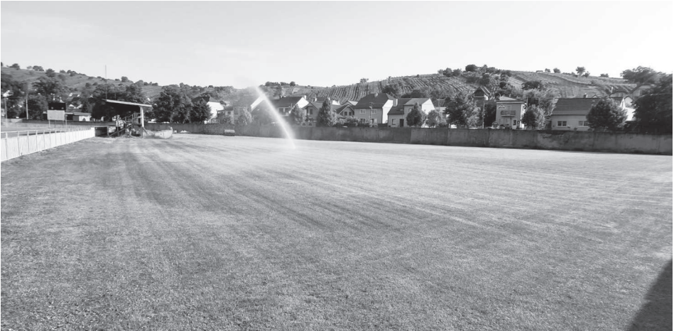
Nová travnatá tréninková plocha