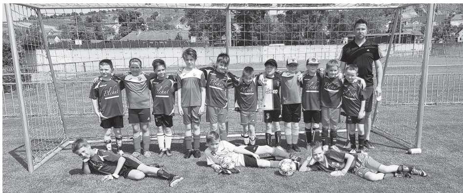
Školička a mladší přípravka