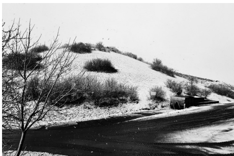
Zima na skládce