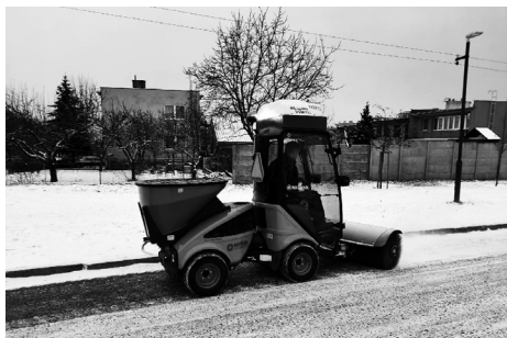
Zametač Egholm City Ranger v akci při odklízení sněhu

Znovu připomínáme všem vinařům, aby nepálili révi ze svých vinohradů a byli trpěliví, jelikož společnost Skládká Hraničky, spol. s r.o. bude i v letošním roce pokračovat v oblibeném svozu a drcení révi od vinařů, které se uskuteční tradičně na přelomu března a dubna. Během letošní zimy jsme naplno