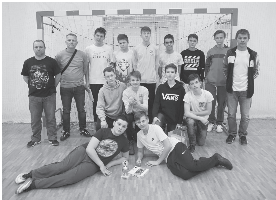
Dubňany Mutěnice starší žáci - 5. místo OHL 2020

soutěže udělali velmi dobré jméno, takže soupeři už na nás budou dobře připraveni a rozhodně nás nikdo nepodcení.