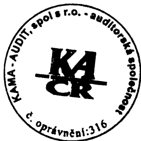
KAMA-AUDIT, spol. s r. o. auditorská společnost, č. 316

DATUM VYHOTOVENÍ ZPRÁVY: 23. května 2017