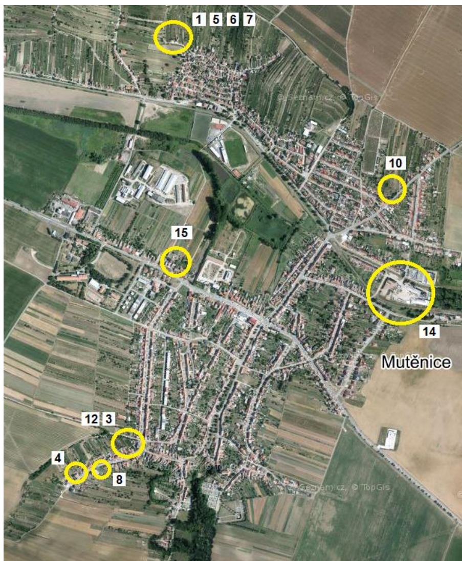
Ortofoto – orientační schéma části dílčích požadavků na provedení změn (obec a lokalita Vinné bůdy)