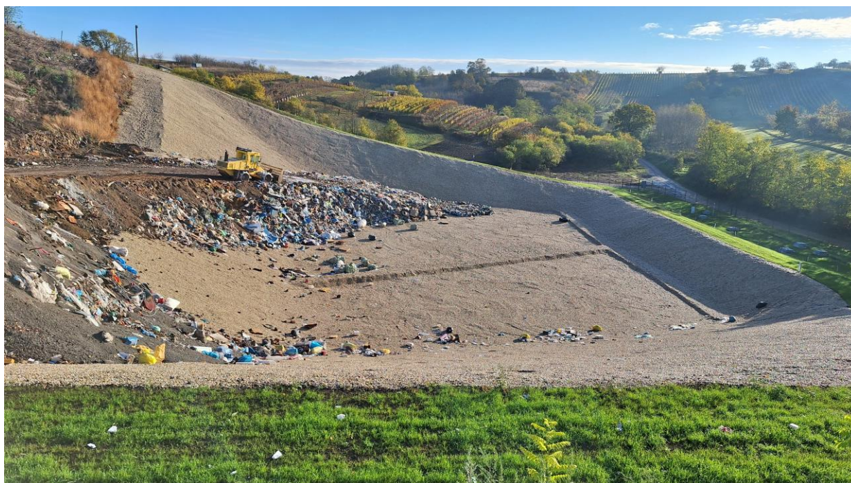
Tabulka č. 1

Největší investicí bylo v r. 2023 pořízení nového kompaktoru BOMAG v hodnotě 6.102.000,- Kč a kamerového a zabezpečovacího systému v hodnotě 417 tis. Kč bez DPH..